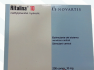
Ritalin 10 mg