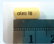
ER Tablet 18 mg

เมทิลเฟนิเดทแซนด์ออส (Methylphenidate Sandoz) ยานี้จะเริ่มออกฤทธิ์ควบคุมสมาธิ ประมาณ 45-60 นาที หลังจากกินยา