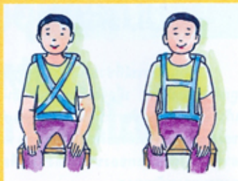
สายรัดชนิดใช้รัดกลางลำตัว

เด็กพิการทางสมองที่ไม่สามารถควบคุมการทรงตัวให้ตั้งตรงได้ สายรัดนี้จะช่วยพยุงบริเวณลำตัวไว้ ทำจากผ้ามีความกว้างประมาณ 1-2 นิ้ว