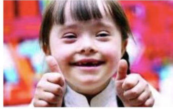
ขอขอบคุณที่ให้ความร่วมมือค่ะ