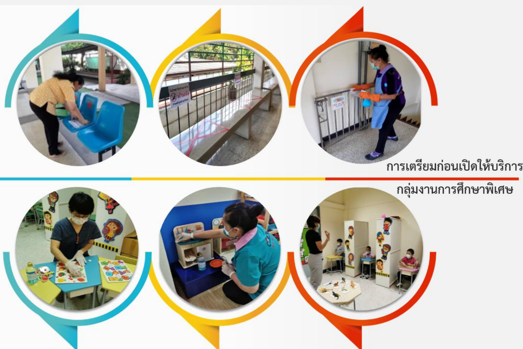
การเตรียมก่อนเปิดให้บริการ กลุ่มงานการศึกษาพิเศษ