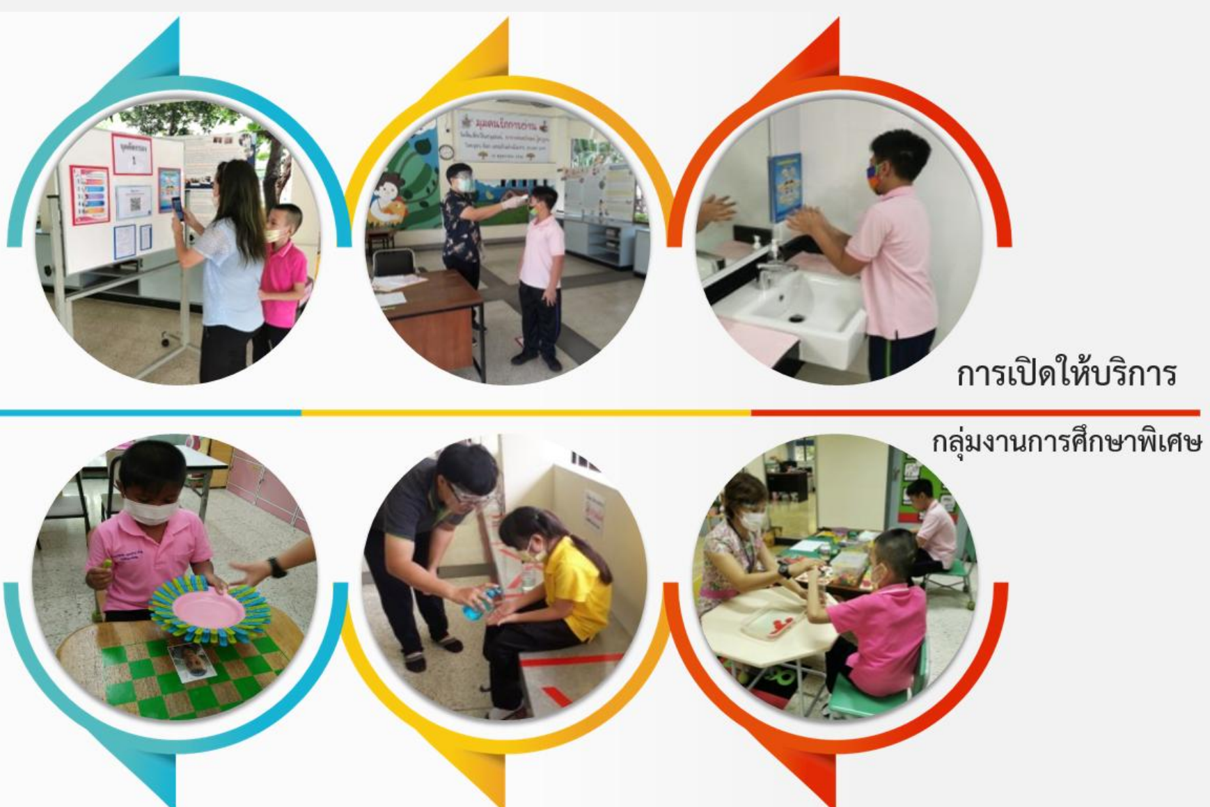
การเปิดให้บริการ กลุ่มงานการศึกษาพิเศษ